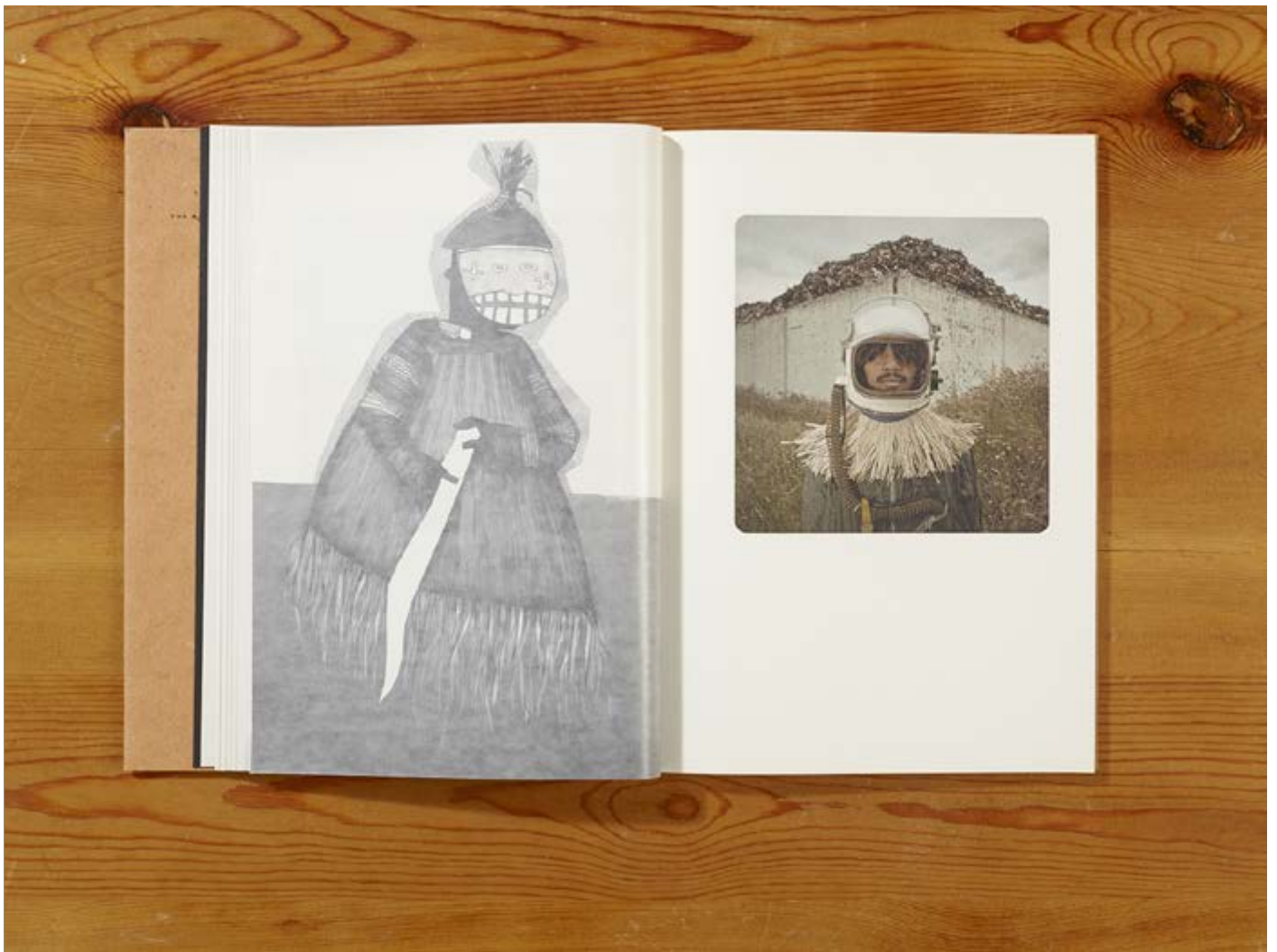
The Afronauts by Cristina de Middel (Spain), Self-published in 2012 Part of the Self Publish, Be Happy Collection at the MEP

"It is incredibly exciting and meaningful for us all that on the tenth anniversary of our organization, our collection of self-published books has found a permanent and beautiful home in the MEP library. Our original mission of collecting, looking after and promoting self-published photobooks via exhibitions, events and educational programmes is now accomplished. Today we are passing the baton to the MEP, which will now have the resources to preserve the work of a generation of photographers and keep it alive by making it available to students, scholars and the general public."