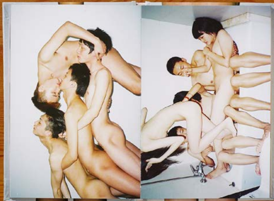
Nude by Ren Hang (China), self-published in 2012 Part of the Self Publish, Be Happy Collection at the MEP